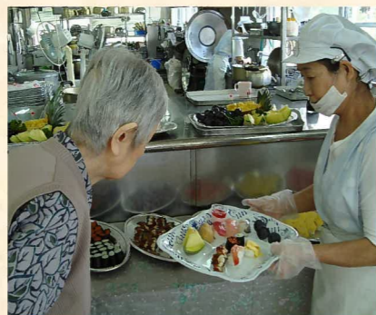
お寿司バイキング

食に関するご要望ではお寿司が一番人気でした。そこで握り寿司のバイキングを実施いたしました。新鮮なネタのお寿司は大変ご好評を頂きましたので、今後も定期的の実施して参ります。